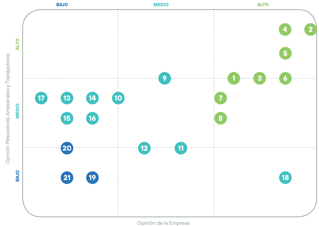
Matriz de Materialidad

El resultado de cada una de las consultas fue analizado y contrastado con los temas materiales identificados por nuestros ejecutivos. Así, se definieron 21 temas materiales que recibieron un orden de importancia de acuerdo a la opinión expresada por los distintos grupos de interés durante el proceso. Esto quedó plasmado en la Matriz de Materialidad que se presenta a continuación. En ella se puede observar 18 temas que fueron categorizados como relevantes.